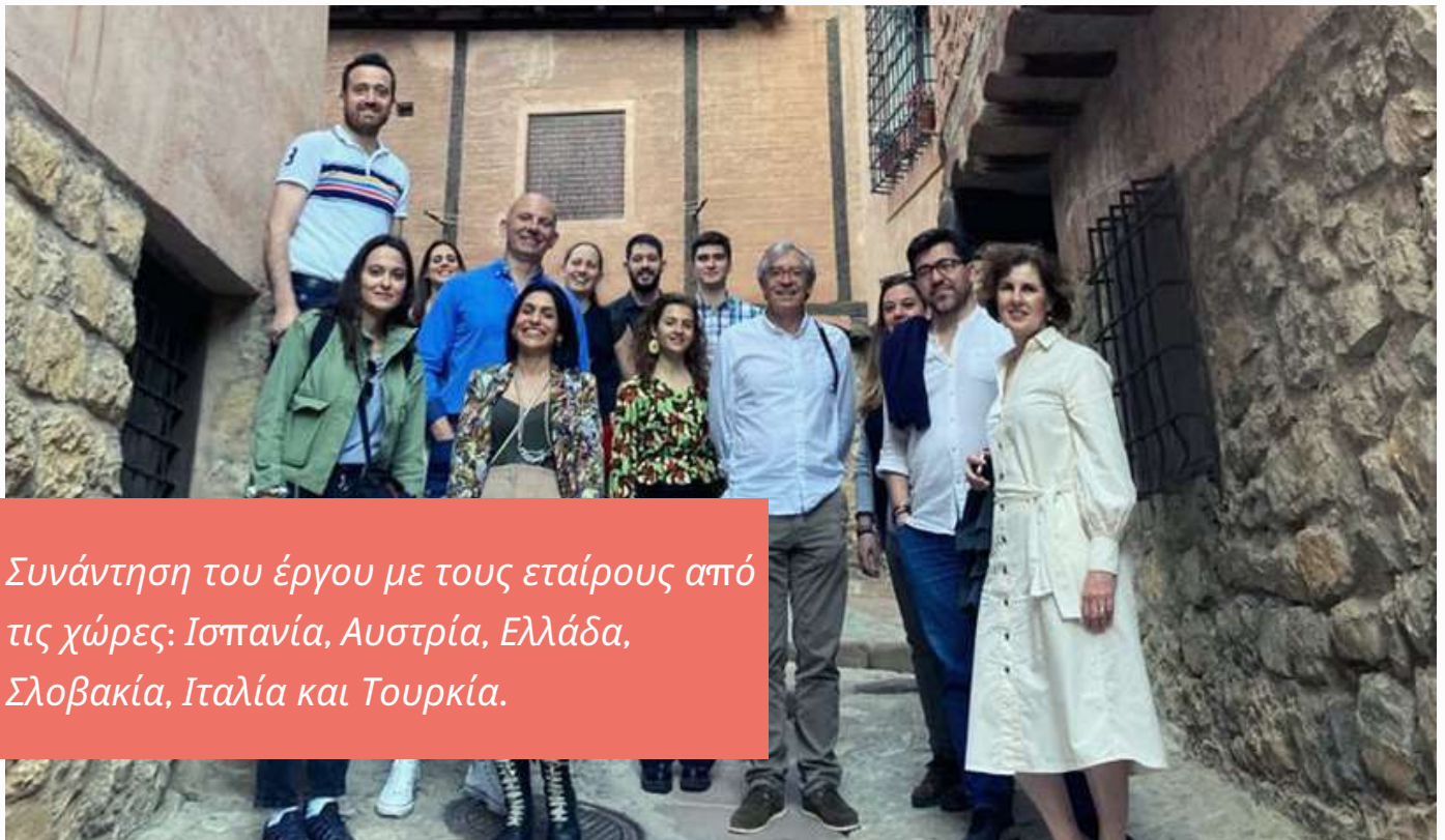
Συνάντηση του έργου με τους εταίρους από τις χώρες: Ισπανία, Αυστρία, Ελλάδα, Σλοβακία, Ιταλία και Τουρκία.

Μετά τις παρουσιάσεις των εταίρων, ξεχώρισαν μεταξύ τους τις αρμοδιότητες που θα έχει ο καθένας στο έργο, και έφυγαν ικανοποιημένοι, έχοντας θεματολογίες να συζητήσουν στην επόμενη συνάντηση.